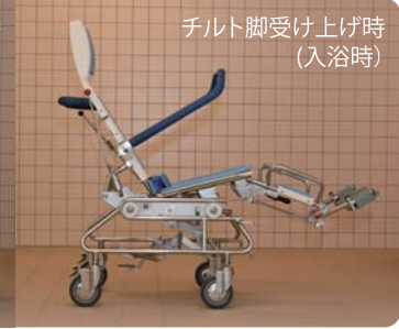
チルト脚受け上げ時 (入浴時)