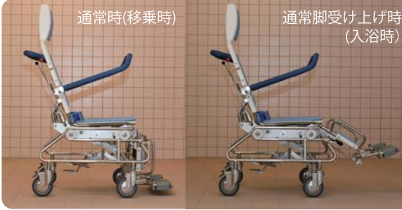
通常脚受け上げ時 (入浴時)